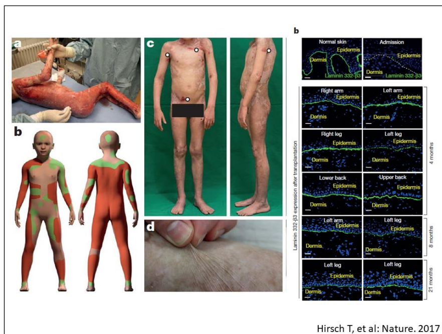
Hirsch T, et al: Nature. 2017

そこで、近年、遺伝子編集技術を用いた遺伝子治療の開発が注目されています。遺伝子編集技術とは、DNA 切断酵素を用いて DNA 上の任意の部位を切断する技術です。この技術を応用することにより、遺伝性疾患患者の変異のある遺伝子配列を正常な遺伝子配列に書き換えることや、遺伝子を数塩基欠失もしくは挿入することが可能になります。前者の遺伝子配列を書き換える手法は、「相同組換え」とも呼ばれます。この相同組換えは、遺伝子変異部分を完全に正常な遺伝子に書き換えることが可能であるため、理想的な遺伝子