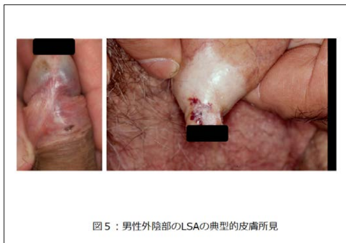
図5：男性外陰部のLSAの典型的皮膚所見

が、圧倒的に女性の外陰部に多い。象牙色の丘疹や局面を呈する。他疾患と鑑別する決定的な所見に乏しいが、女性の外陰部の場合は、そう痒や痛みを伴う刺激感、外観上の角化性変化を診断の参考にすることを提案する”。推奨度は2Dです。男女比は1:10で女性に多く、婦人科受診者の1.7%に見られたとの報告があります。女性外陰部の症例(図4)は、初経前と閉経後の2つの発症ピークがあり、一方で男性は30-50歳に発症が多いです(図5)。