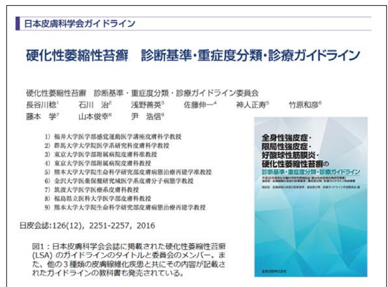
図1: 日本皮膚科学会会誌に掲載された硬化性萎縮性苔癬(LSA)のガイドラインのタイトルと委員会のメンバー。また、他の3種類の皮膚線維化疾患と共にその内容が記載されたガイドラインの教科書も発売されている。