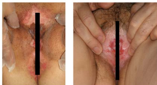
図4： 女性外陰部のLSAの典型的皮膚所見