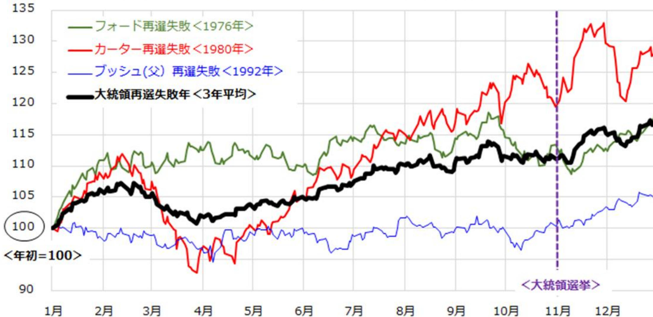
「現職大統領・再選失敗年」（1976、80、92年）のS&P500指数と平均推移