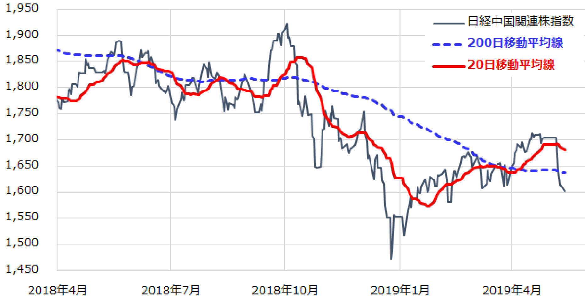
日本の中国関連株と移動平均線